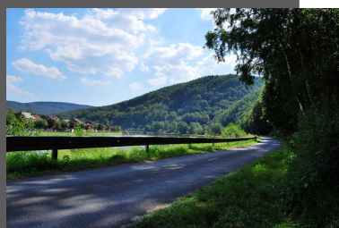
Au fil de la boucle C. Czarny