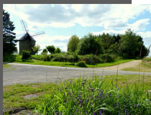
Moulin à la croisée des chemins C. Philipotteaux